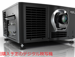
※今回購入予定のデジタル映写機